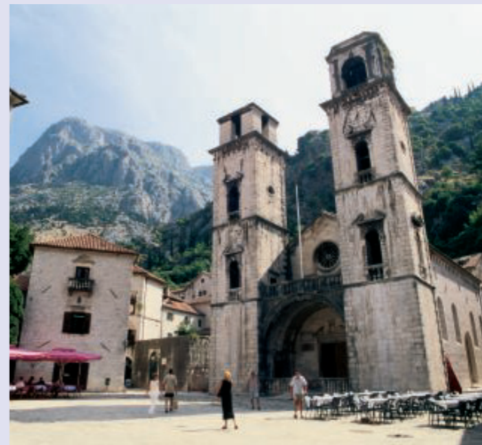
Kathedrale von Kotor, Montenegro