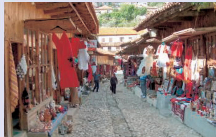
Markt in Berat, Albanien