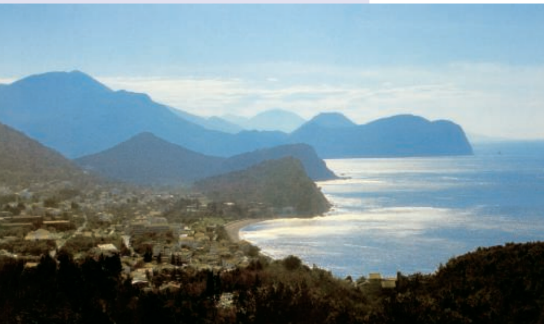
Küstenlandschaft in Montenegro