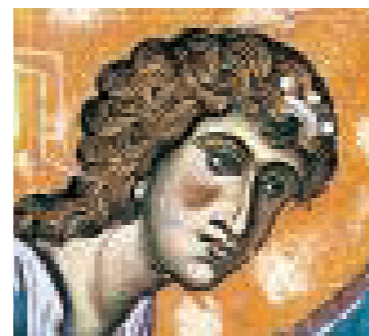
Fresko von Kurbinovo, Mazedonien