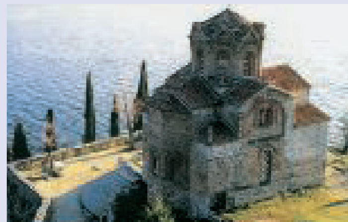
Kirche am Ohridsee in Mazedonien